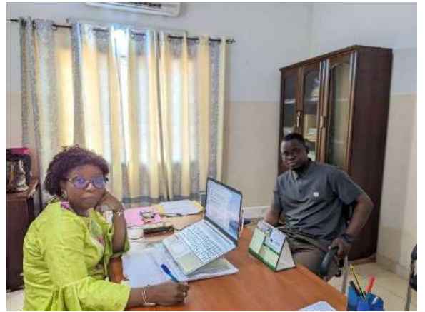
Entretien avec la CA ANPE Atlantique 2