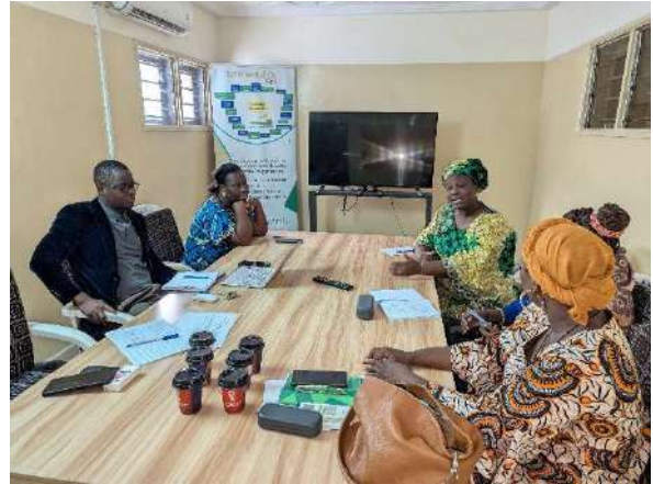
Entretien avec la FEFA Bénin