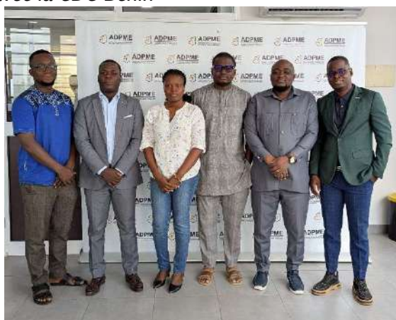
Séance de travail avec l'ADPME