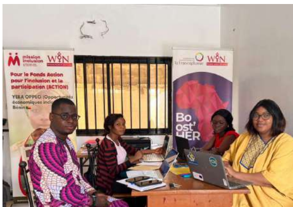
Entretien avec le réseau WIN Bénin