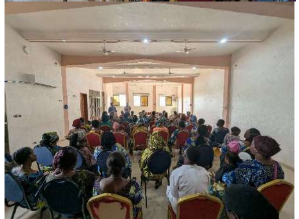
Consultation publique avec les femmes entrepreneurs réunies à Abomey-Calavi