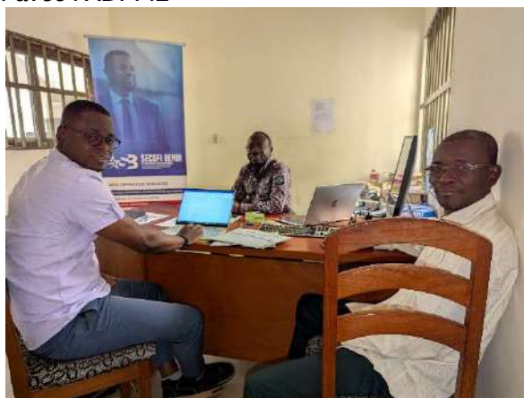
Entretien avec la SAE SECOFI Bénin