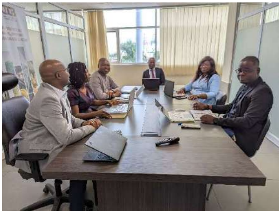
Séance de travail avec la CDC Bénin