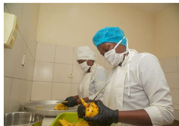
Photos : Entreprises gérées par des femmes ayant bénéficiées de l'appui du projet ProPME.

Publié par : Deutsche Gesellschaft für Internationale Zusammenarbeit (GIZ) GmbH Siège de la société : Dag-Hammarskjöld Weg 1-5 D-65760 Eschborn Deutschland T: +49 (0)61 96 79-11 75 F: +49 (0)61 96 79-11 15 Friedrich-Ebert-Allee 32+36 D-53113 Bonn Allemagne T: +49 (0)228 44 60-0 F: +49 (0)228 44 60-17 66